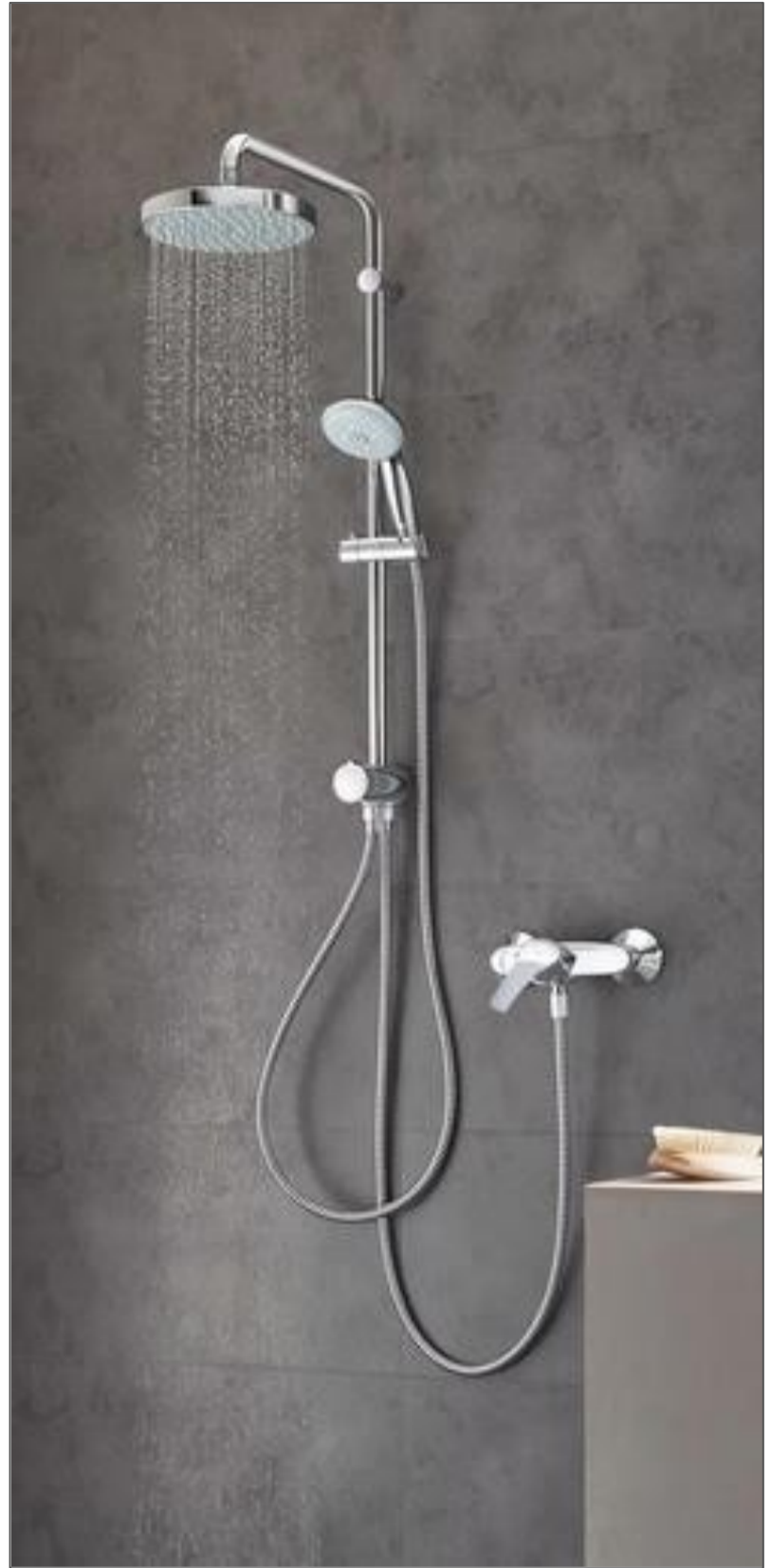
- Grifos de la marca "Grohe".